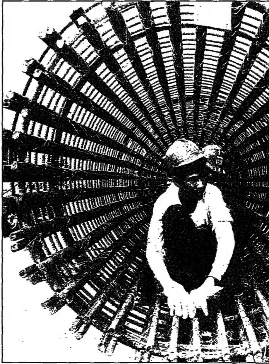
عامل يثبت قضباناً فولاذية في هيكل معنوي لتقوية إحدى العمارات التي ستملح خط حديد مرفوعا بجري انشائه في وسط العاصمة القطرية مانيلا

نيقوسيا - رويترز: ذكرت نشرة ميل إيست إيكونوميك سيرفي في (ميس) النفطية المتخصصة أمس الاثنين أن مؤسسة تسويق النفط الحكومية (سومو) سيجدد عقود تصدير النفط الخام للايام التسعين التالية من اتفاق التسليم مع الامم المتحدة.